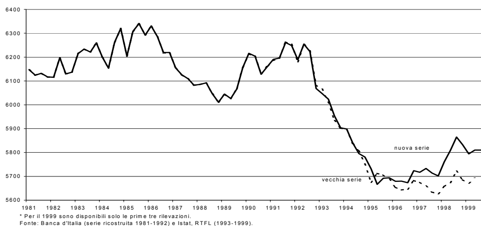
Andamento dell'occupazione nel Mezzogiorno (migliaia di persone, dati trimestrali destagionalizzati) 1981 - 1999*

La struttura produttiva del Mezzogiorno è caratterizzata ancora da una forte debolezza strutturale. Nel confronto con il resto d'Italia è infatti maggiore - e in assoluto ancora elevato - il peso del settore agricolo (nei dati più recenti dell'Indagine sulle forze di lavoro, il 9,4% delle persone occupate, contro il 5,4% della media nazionale); l'industria manifatturiera è pari al 23,5% contro il 32% della media nazionale; è forte il peso di servizi privati a bassa produttività; stante anche l'inferiore livello di occupazione nell'area è più elevata l'incidenza degli occupati della Pubblica Amministrazione, che talvolta ha anche assolto un ruolo improprio di sostegno dei redditi. Anche nel confronto europeo, la peculiarità della struttura produttiva del Mezzogiorno emerge in tutta evidenza.