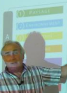
TABLEAU D'ANALYSE DES IMPACTS DE LA TEMPÊTE KLAUS