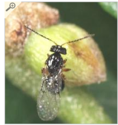
Cinipide del castagno: una femmina sulla gemma

Si è tenuta venerdì 24, nella Sala 'Cavour' del ministero delle Politiche agricole alimentari e forestali, la riunione del 'Tavolo di filiera frutta in guscio - sezione castagne', alla quale hanno partecipato rappresentanti del ministero insieme a esponenti delle Regioni, delle amministrazioni provinciali e comunali e delle associazioni di categoria.