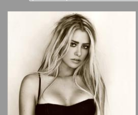
Fiocco rosa per Martina Stella: è nata la piccola Ginevra...