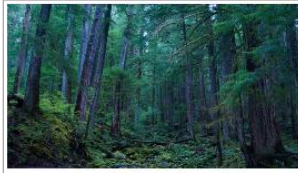
Necessaria una nuova politica nazionale delle foreste

La richiesta arriva dall'Osservatorio Foreste dell'Inea e dalla Rete Rurale Nazionale in vista della giornata internazionale del bosco promossa dalla Fao